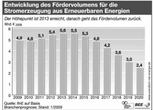
Abb.3: Entwicklung der EEG-Umlage bis 2020

Ziel der großen Energiekonzerne war und ist, die Energiewende um weitere 30-40 Jahre hinauszuzögern und dann die Beschaffung Erneuerbarer Energien so zu organisieren, dass das Geschäft größtenteils in ihren Händen liegt.