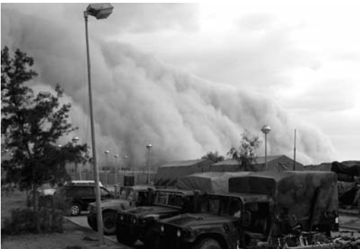
Abb. 1: Sandsturm in Al Asad, Irak, Quelle: www.wikipedia.org

Wie sieht es zum Beispiel mit der Langlebigkeit von Installationen in Wüstenzonen aus? Gerade Wendekreiswüsten wie die Sahara oder die arabische Halbinsel charakterisieren sich durch ein extremes Klima, das enorme Tag-Nacht-Schwankungen der Temperaturen aufweist. So kann die Temperatur tagsüber bis auf 60°C steigen, um nachts auf bis zu -10°C zu fallen. Dies führt zu einer enormen physikalischen Verwitterung, wie